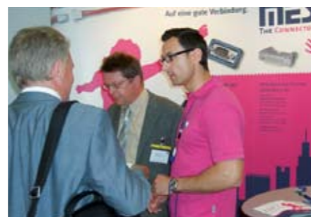
...SMT/HYBRID/PACKAGING wurden interessante Gespräche geführt.

Es ist immer wieder spannend, mit welchen neuen Anforderungen uns Kunden ansprechen und individuell passende, wirtschaftlich attraktive Lösungen erwarten. Deshalb sind Messen für MES ein Tor zum Anwender, das über persönliches Kennenlernen und direkten Gedankenaustausch hinaus eine Plattform schafft für innovative Verbindungstechnik, die nachhaltig erfolgreiche Zusammenarbeit mit anspruchsvollen Kunden inszeniert und bestätigt.