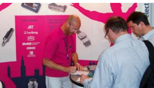
Sowohl auf der embeddedworld 2010 sowie auf der...